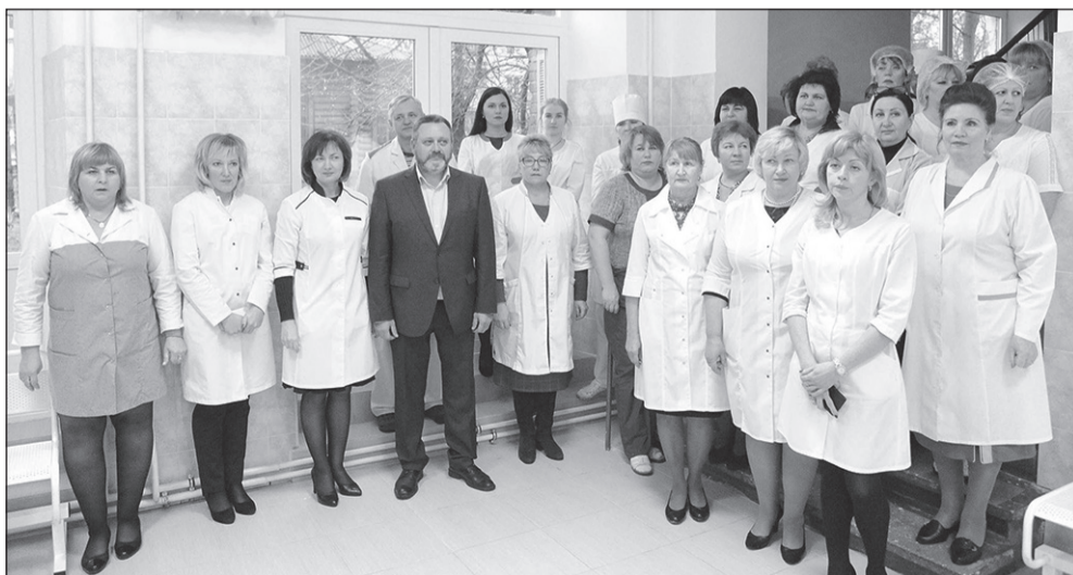
Среди врачей, которые сейчас трудятся в Клиновках, немало специалистов из других регионов — Курска, Смоленска, Оренбурга и даже соседней Белоруссии. Как говорят молодые специалисты, в Брянскую область они приехали, потому что здесь условия лучше.