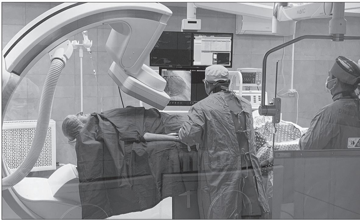
Высокие технологии в медицине добрались и до отдаленных районов Брянщины.

— Еще и до утверждения этой действительно нужной для всей Брянщины программы правительство региона стало уделять серьезное внимание переоснащению и дооснащению оборудованием лечебных заведений. Для многих медицинских учреждений области (в том числе для Клиновской городской больницы) была приобретена уникальная рентгеновская система, которая позволяет врачам оперативно распознать изменения, происходящие в сосудах и тканях. Такой прибор стоит 36,3 миллиона рублей. Подобного оборудования никогда не было на юго-западе Брянской области. Для сравнения: десять лет назад в России было только три таких системы, а сегодня Брян-