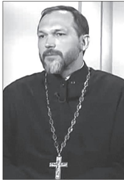
– После войны немало фронтовиков выбрали для себя путь священнослужения.

– Конечно. Исторический факт: в 1943-м Иосиф Сталин вызвал к себе трех ведущих иерархов Русской православной церкви, среди них были двое уже упомянутых нами и глава Церкви митрополит Сергей (Старгородский). Это была историческая встреча. Именно на ней были приняты решения о возрождении патриаршества, об открытии трех богословских школ; после нее многих иерархов и священников выпустили из застенков, репрессированных оправдали.